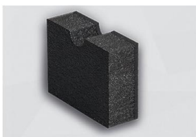
491 SBF / 491 EVA