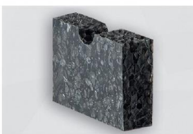
D 2600 F-01 NK (Rückseite)