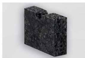
D 2600 SK-05

BITTE BEACHTEN SIE UNSERE VERARBEITUNGS-/LAGERUNGSHINWEISE • ISO 9001 ZERTIFIZIERT • CELLOFOAM GMBH & CO. KG