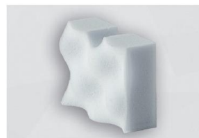
HR 290 HO NOPPE

BITTE BEACHTEN SIE UNSERE VERARBEITUNGS-/LAGERUNGSHINWEISE • ISO 9001 ZERTIFIZIERT • CELLOFOAM GMBH & CO. KG