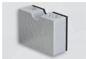
HR 290 HO 95/EVA