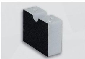
HR 290 HO VLC