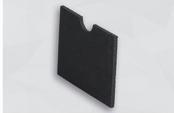
MUSTER EVA 6-01 SK

Anwendungen: Bau- und Landmaschinen, Busse/Nutzfahrzeuge, Haushaltsgeräte, Heizung/Lüftung/Klima, Kabinen/Kapseln/Hauben, Maschinenbau