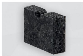
D 2600 SK-05

BITTE BEACHTEN SIE UNSERE VERARBEITUNGS-/LAGERUNGSHINWEISE • ISO 9001 ZERTIFIZIERT • CELLOFOAM GMBH & CO. KG