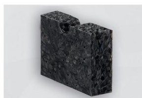
D 2600 SK-05

BITTE BEACHTEN SIE UNSERE VERARBEITUNGS-/LAGERUNGSHINWEISE • ISO 9001 ZERTIFIZIERT • CELLOFOAM GMBH & CO. KG