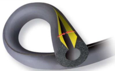
K-FLEX ST SCHLÄUCHE SELBSTKLEBEND