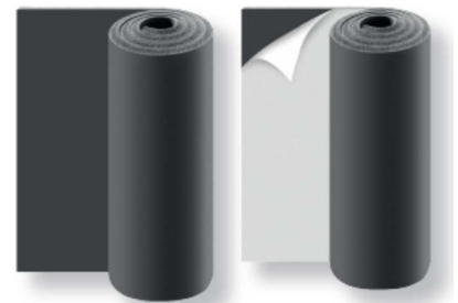
K-FLEX ST PLATTEN

1 m breit, endlos, mit und ohne Selbstklebebeschichtung